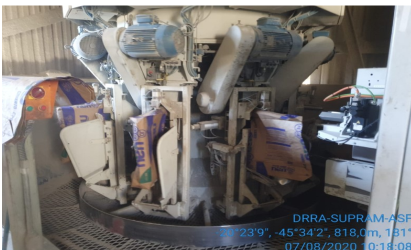
Figura 03: Parte do processo produtivo

Um sistema de ciclones, filtro de mangas e ventilador remove o cimento do interior do moinho para o silo de cimento, e desse, por gravidade alimenta as ensacadeiras rotativas automáticas.