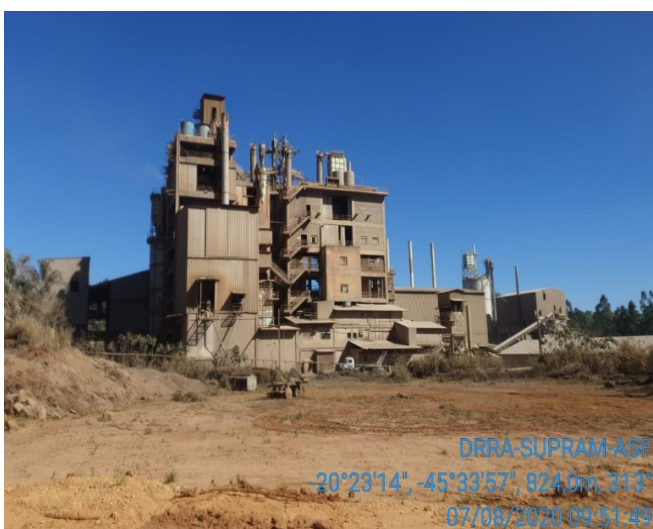
Foto 01. Vista da empresa