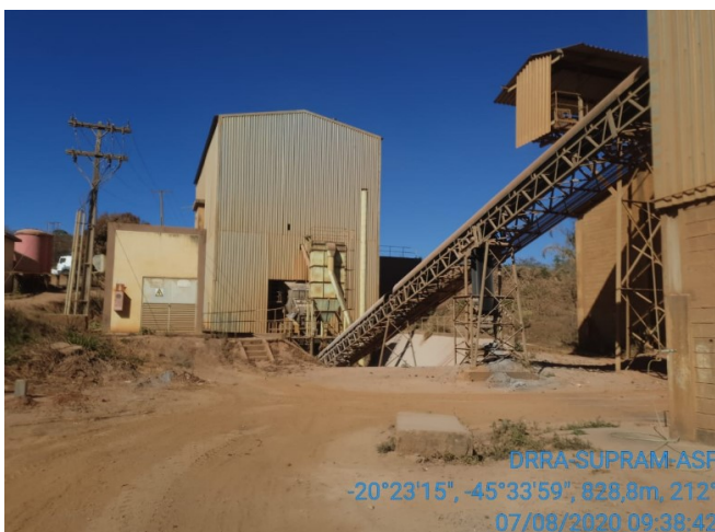
Foto 03. Parte do processo produtivo