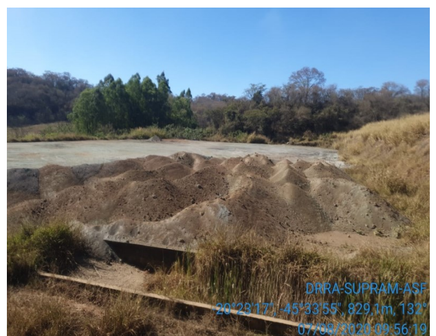
Foto 02. Pátio para armazenamento de resíduos