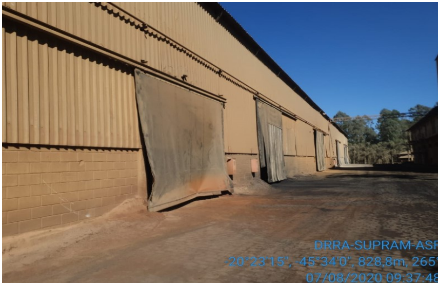
Figura 01: Galpões de estocagem

O setor de moagem de farinha é constituído por moinhos, fomalhas verticais de leito fluidizado, utilizando coque de petróleo como combustível. As matérias primas dosadas nos silos de alimentação dos moinhos verticais de farinha são descarregadas através de dosadores gravimétricos diretamente no interior desses, onde um conjunto de rolos promove a fragmentação e moagem dos mesmos sobre um prato de moagem. Nestes moinhos, são injetados os gases quentes provenientes das fomalhas os quais tem por objetivo a secagem dos materiais e a remoção da farinha produzida.