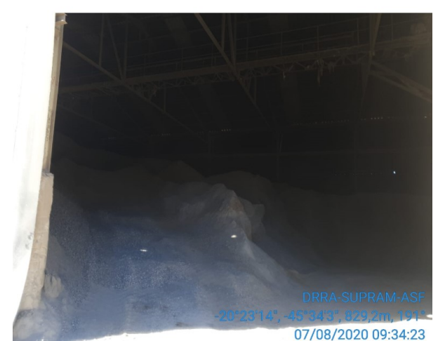
Foto 04. Parte interna dos silos