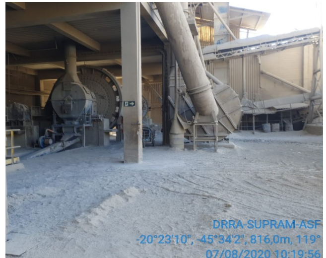
Figura 02: Parte do processo produtivo

O material particulado recuperado é reintroduzido no processo juntamente com a matéria prima na produção da farinha. O clínquer produzido é removido na parte inferior do forno vertical por meio de um sistema de válvula rotativa circular, a qual descarrega o clínquer previamente resfriado em um transportador de correias. Desse transportador de correias, o clínquer é levado para um galpão de matérias primas da moagem de cimento, onde, então, é removido por meio de um sistema de tremonhas dosadoras juntamente com a escória de alto forno e o gesso para um silo de alimentação do moinho horizontal de bolas de cimento.