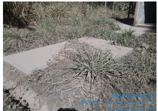
Foto 07. Tanque de abastecimento

DRRA-SUPRAM-ASF -20°23'11", -45°34'5", 815,6m, 281° 07/08/2020 10:14:47