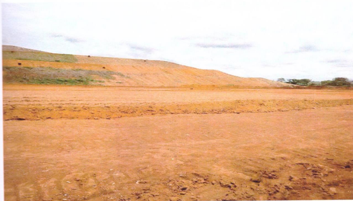
FOTO 6: VISTA PARCIAL DOS TRABALHOS DE CONSTRUÇÃO DO SISTEMA DE IMPERMEABILIZAÇÃO DA CÉLULA 3.