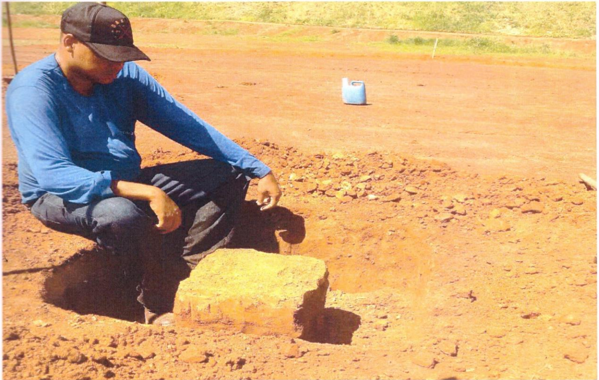
FOTO 13 : EXTRAÇÃO DE CORPO DE PROVA PARA A DETERMINAÇÃO DA DENSIDADE "IN SITU".