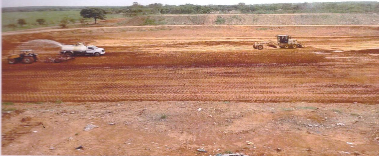
FOTO 1 : VISTA GERAL DAS ATIVIDADES DE REGULARIZAÇÃO E COMPACTAÇÃO DE SUBLEITO.