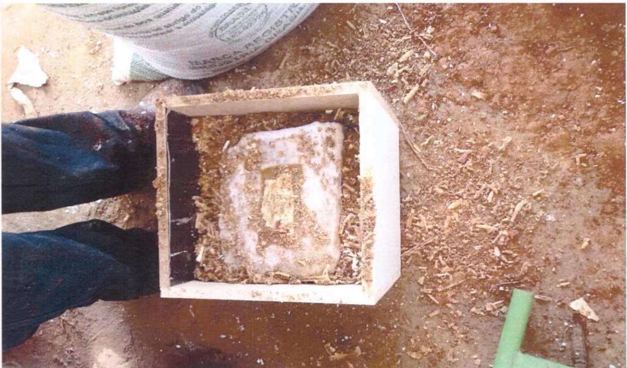
FOTO 14 : PREPARAÇÃO DOS CORPOS DE PROVA PARA O TRANSPORTE ATÉ O LABORATORIO EM BH.