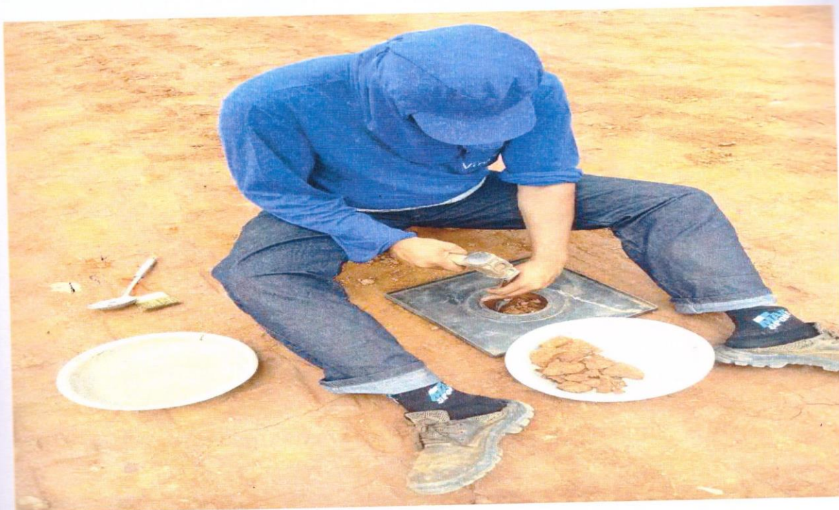
FOTO 9 : REALIZAÇÃO DE ENSAIOS PARA A DETERMINAÇÃO DO GRAU DE COMPACTAÇÃO DO SOLO.