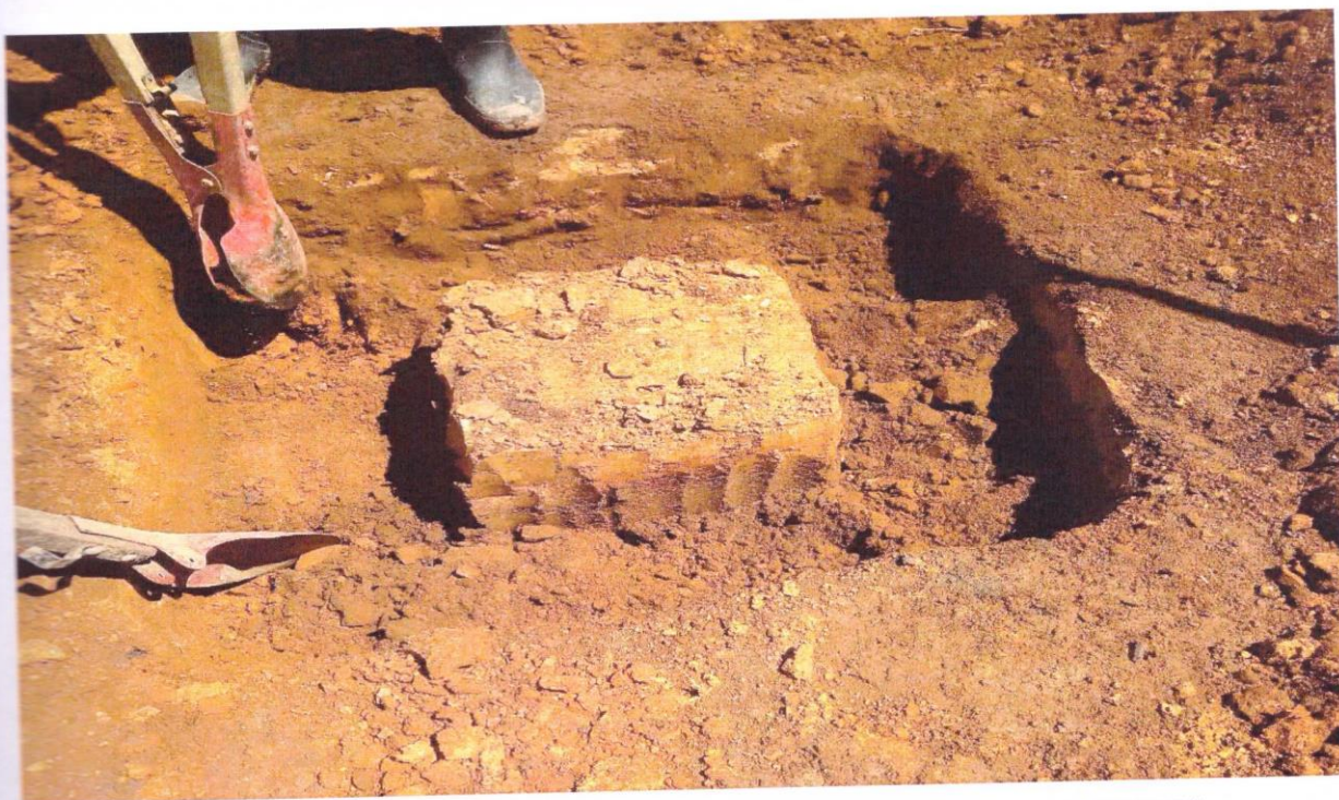
FOTO 12 : EXTRAÇÃO DE CORPO DE PROVA PARA A DETERMINAÇÃO DA DENSIDADE "IN SITU".