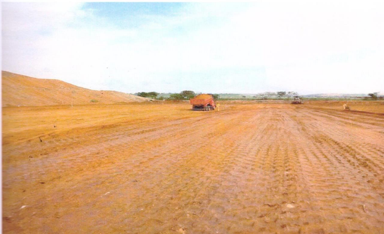
FOTO 7: VISTA PARCIAL DOS TRABALHOS DE CONSTRUÇÃO DO SISTEMA DE IMPERMEABILIZAÇÃO DA CÉLULA 3.