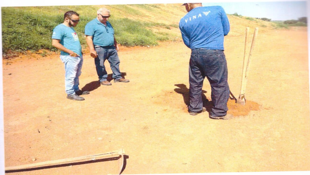
FOTO 11 : EXTRAÇÃO DE CORPO DE PROVA PARA A DETERMINAÇÃO DA DENSIDADE "IN SITU".