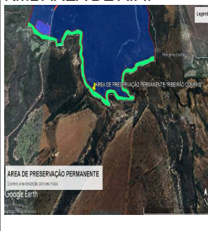
KML AREA DE A.P.P