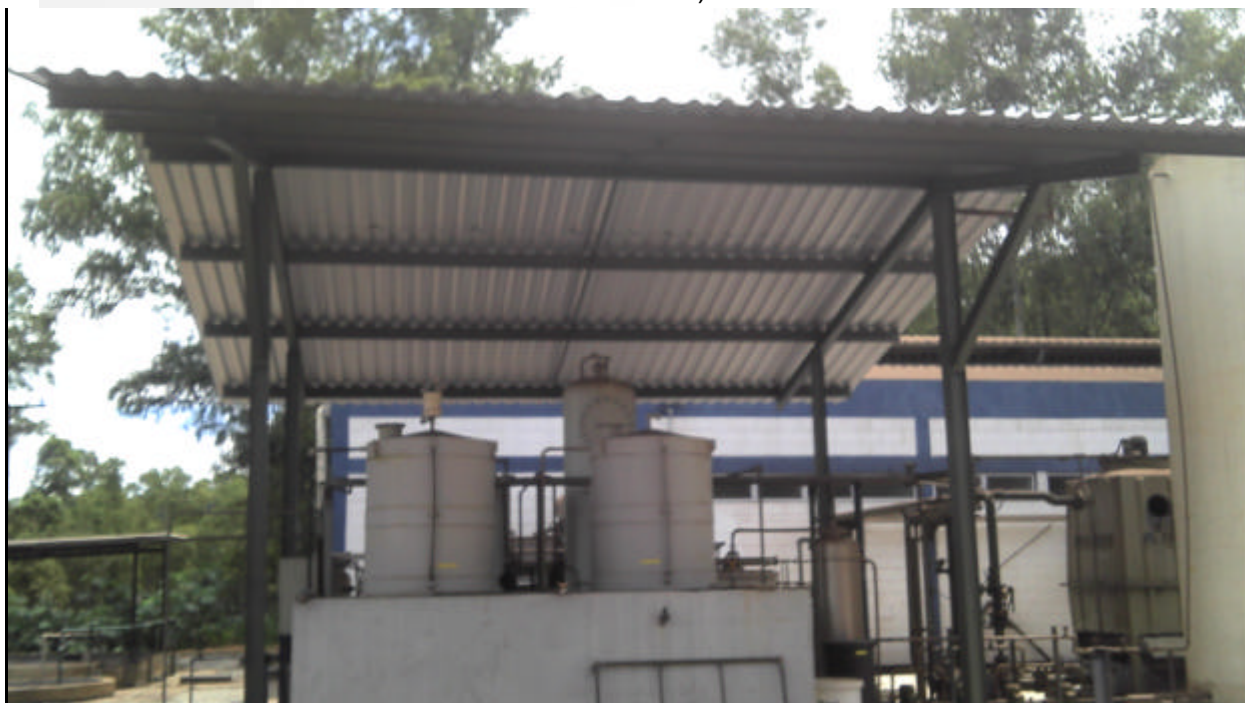
Foto 03: Abrigo coberto e dotado de caixa de contenção para os produtos químicos e óleo utilizados no processo (atendimento à condicionante nº 03 da LP+LI).