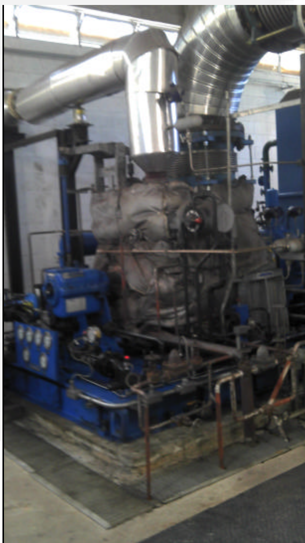
Foto 01: Turbina e gerador da usina termoelétrica do Alto Forno I

Empreendedor: AVG Siderurgia Ltda. Empreendimento: Usina Termoelétrica do Alto Forno I CNPJ: 20.176.160/0002-84 Município: Sete Lagoas Atividade: Produção de Energia Termoelétrica Código DN 74/04: E-02-02-1 Processo: 00017/1988/015/2012 Validade: 6 (seis) anos