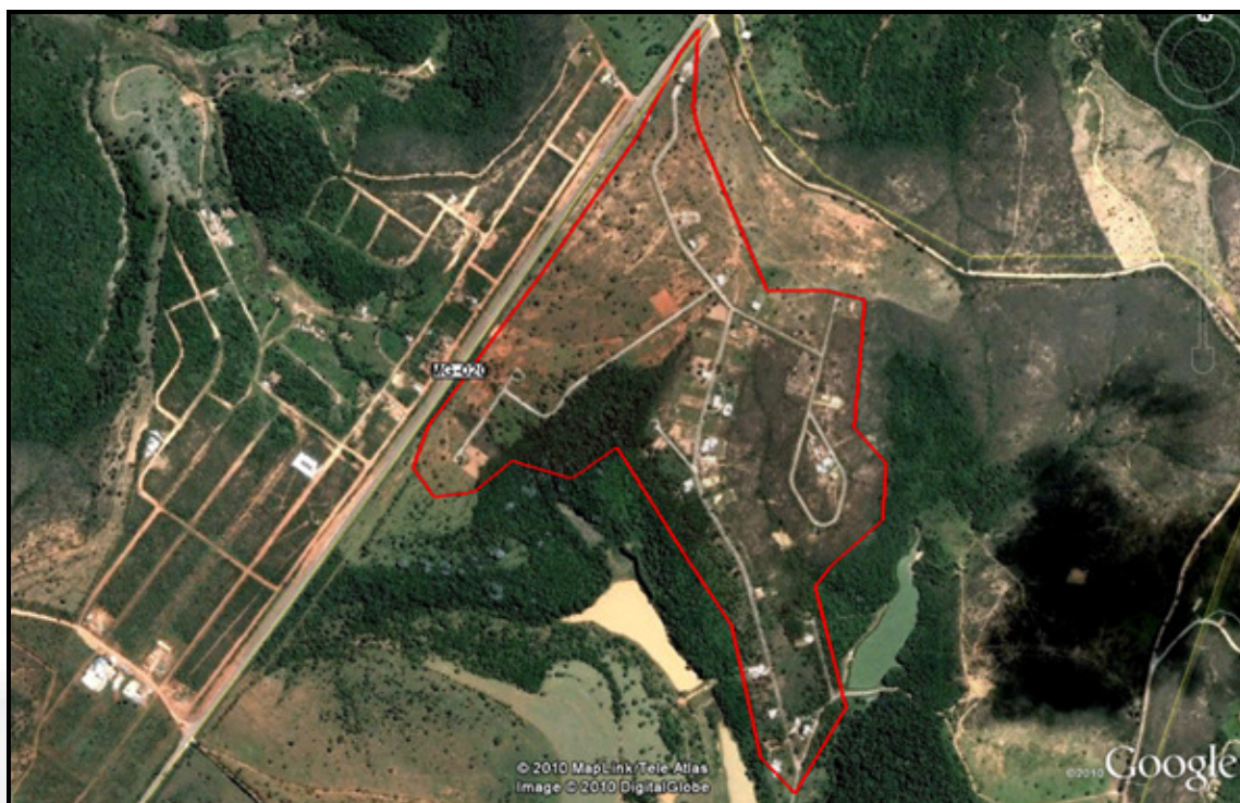
Figura 01 – Localização do empreendimento Pqe. das Águas de Serra Morena – Residencial I.

Consta no processo o registro de imóvel da área total do empreendimento de 40,5347 ha conforme matrícula nº 11.095, livro 2AJ, fl. 55 da Comarca de Caeté.