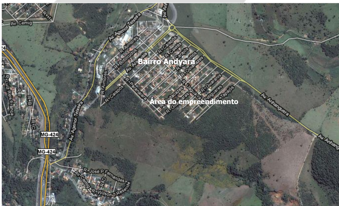
Fig. 01 - Área do empreendimento - acesso

De acordo com o projeto urbanístico, o acesso ao Residencial Portal Central Park será feito através da Avenida Anhanguera que liga Pedro Leopoldo a Confins e em seguida pela Rua Tapajós, sendo esta uma via já existente (pavimentada) e que faz parte do Bairro Parque Andryara que faz divisa com o empreendimento.