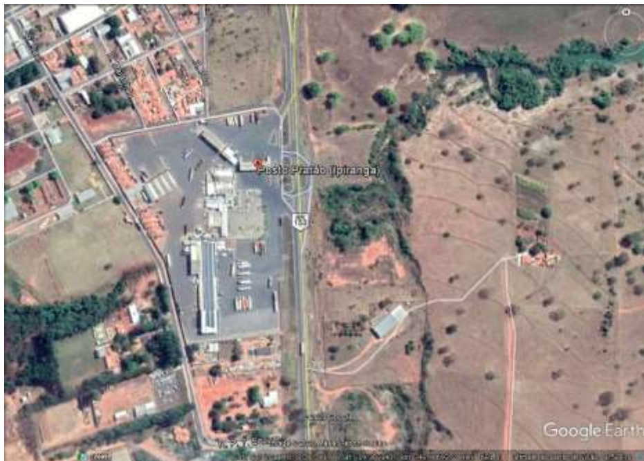
Localização geográfica do empreendimento – Google Earth 2020.

A elaboração deste parecer único é destinado a subsidiar a decisão quanto à requisição de Renovação de Licença de Operação do empreendimento Posto Pratão Ltda, que se encontra situado na rodovia BR 153, km 109, zona urbana do Município de Prata - MG.