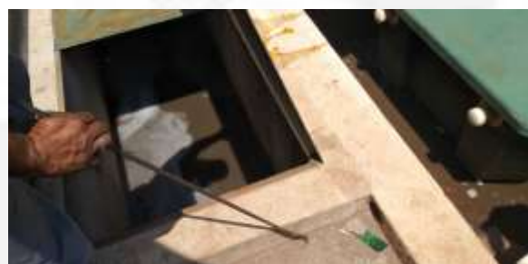
Caixa separadora de água e óleo