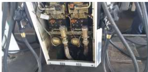
Bomba de combustível com sump e check valve