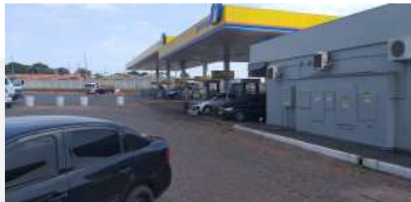
Pistas de abastecimento