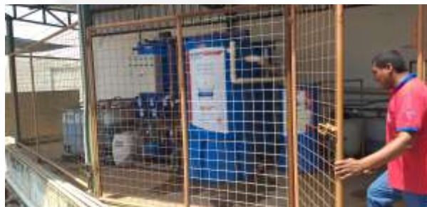
Parte de ETE existente