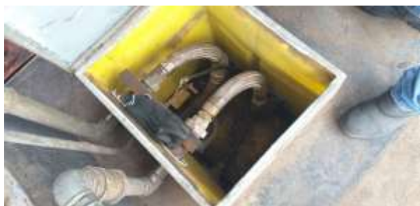
Sump do filtro de diesel