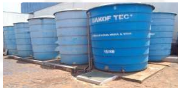
Equipamentos de ETE existente