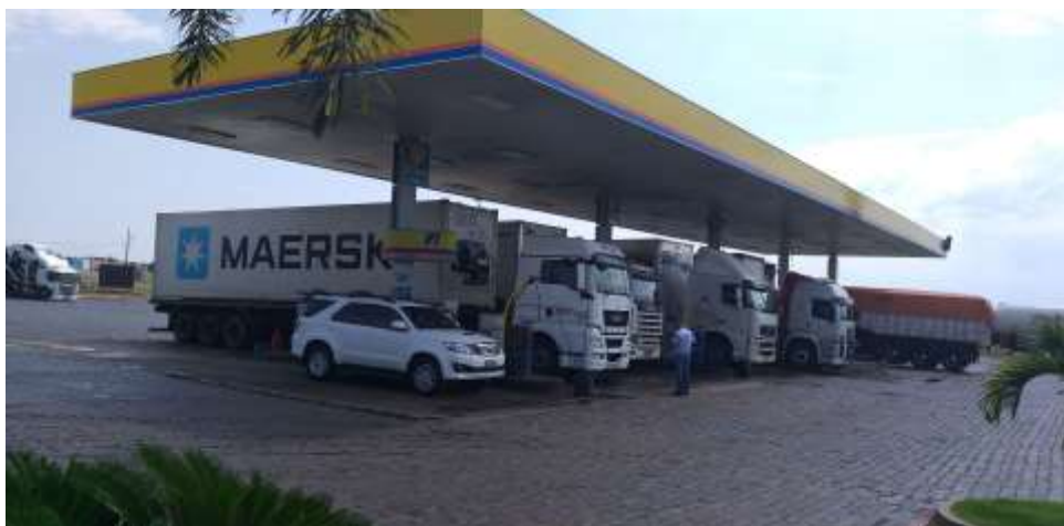
Foto vistoria- vista de uma das pistas de abastecimento