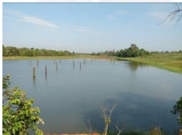
Foto 04. Barragem