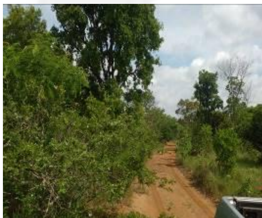
Foto 03. Área de Reserva Legal