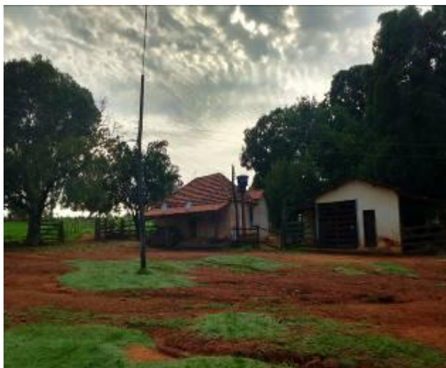
Foto 01. Sede da Fazenda