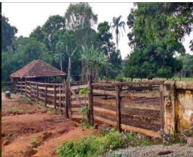
Foto 02. Curral