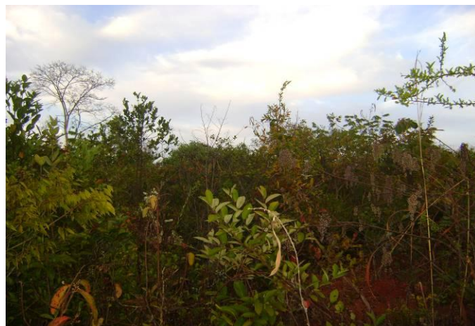
Foto 01 e 02 - Vista parcial da área de Reserva Legal da propriedade.