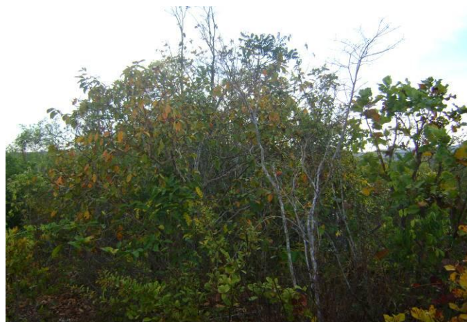
Foto 05 e 06 - Vista parcial da área passível de autorização da propriedade.