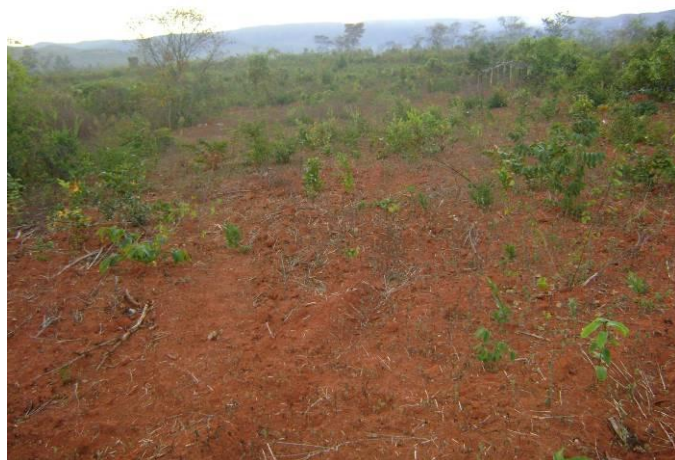
Foto 03 e 04 - Vista parcial da área de cultura da propriedade.