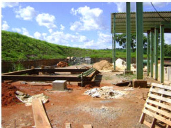
Obras civis – Periféricos em fase de construção