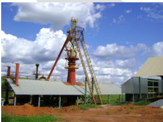
Vista Geral do empreendimento

Abaixo relatório fotográfico da situação encontrada nesta vistoria: