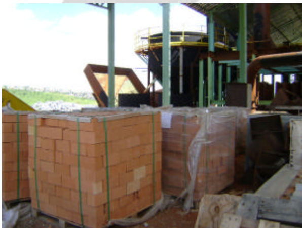
Refratários de revestimento interno do forno