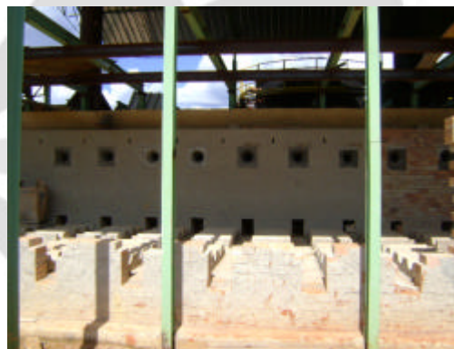
Vista interna do forno