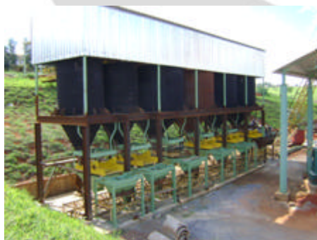
Vista dos silos de agregados – Sistema em fase de acabamento