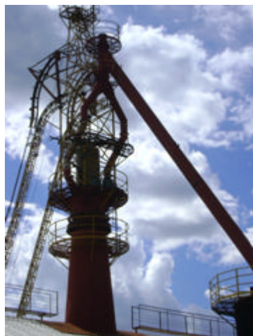
Vista da chaminé do forno – Fechamento do chifre do forno – Atendimento a DN 49