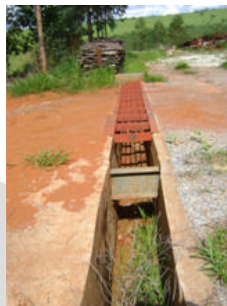
Canaletas de drenagem pluvial – Atendimento a DN 49