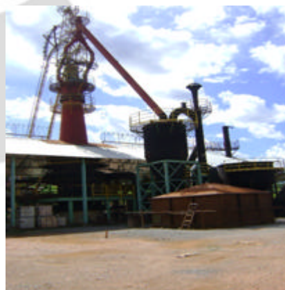
Fechamento dos chifres do forno – Atendimento a DN 49