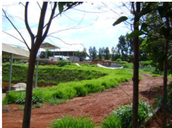
Vista geral do acesso ao empreendimento

Neste sentido, o empreendedor requer a prorrogação do prazo da licença de instalação por mais 01 (um) ano, prazo este suficiente para a finalização das obras de acordo com as especificações constantes dos planos, programas e projetos aprovados, conforme PA nº 03261/2005/001/2005 e parecer técnico DMET nº 131/2006 emitido pela DIMET/FEAM.