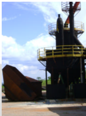
Fase final de implantação dos sistemas de controle ambiental – Lavagem dos gases – Sistema de Recirculação em circuito fechado