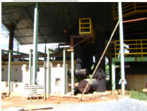
Fase final de construção civil do forno