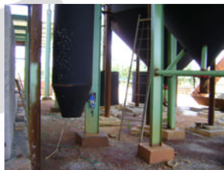
Montagem mecânica dos silos de despoeiramento – sistema de controle ambiental