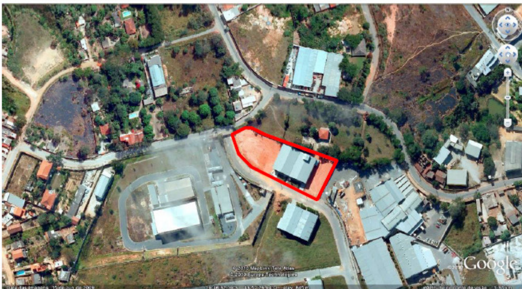
Figura 02 – Vista aérea do terreno e das áreas construídas da Topfime.

A empresa está operando no Condomínio Industrial Parque Norte de Vespasiano, próximo ao Centro Administrativo de Belo Horizonte, cuja atividade principal constitui-se na moldagem de termoplástico não organo-clorado, sem a utilização de matéria-prima reciclada ou com a utilização de matéria-prima reciclada a seco, com utilização de tinta para gravação. Veja figura 02 abaixo: