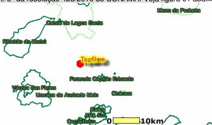
Figura 01 – Localização da Topfilme em relação as unidades de conservação

A Topfilme Indústria de Materiais Plásticos Ltda., está localizada na bacia do Rio São Francisco e sub-bacia do Rio das Velhas, sob as coordenadas geográficas: Lat.: 19°46'32" S e Long.: 43°57'27" W, não sendo necessário as anuências dos gestores das unidades de conservação, por estar o empreendimento localizado a mais de 2 km destas unidades, de acordo com o art. 5º da resolução 428/2010 do CONAMA. Veja figura 01 abaixo: