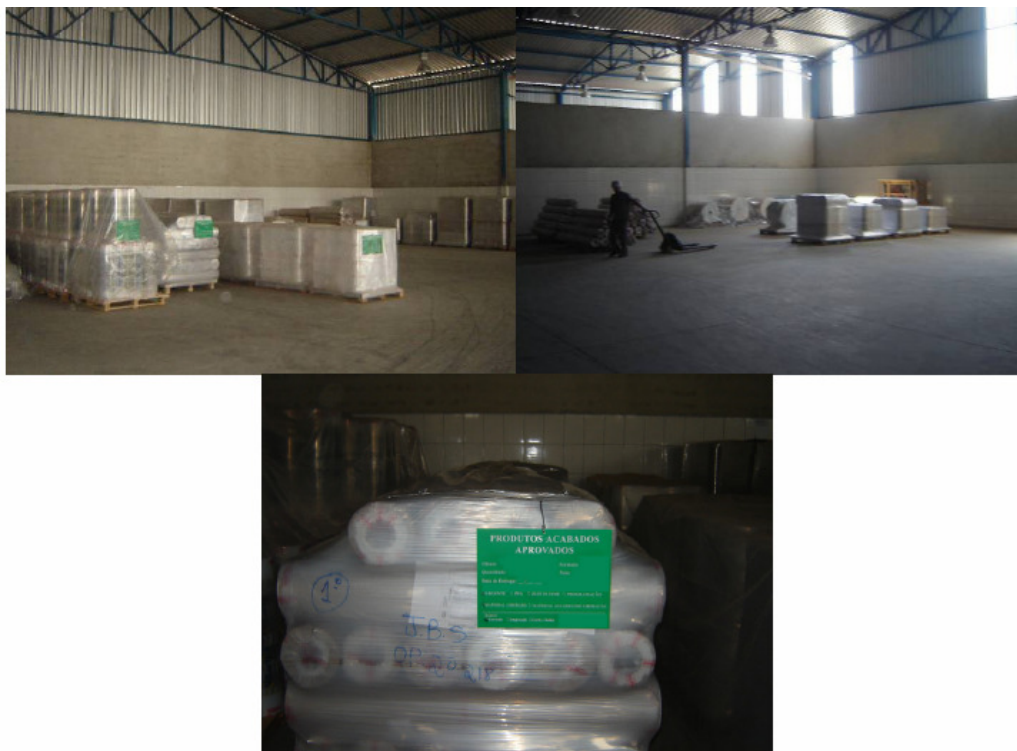
Figura 03 – Produtos finais, embalagens plásticas

As instalações industriais da TOPFILME estão implantadas em um terreno de 4.845,5 m 2 , com área construída de 2.815 m 2 .