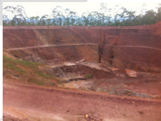
Cava exaurida onde será implantada a Barragem RG2