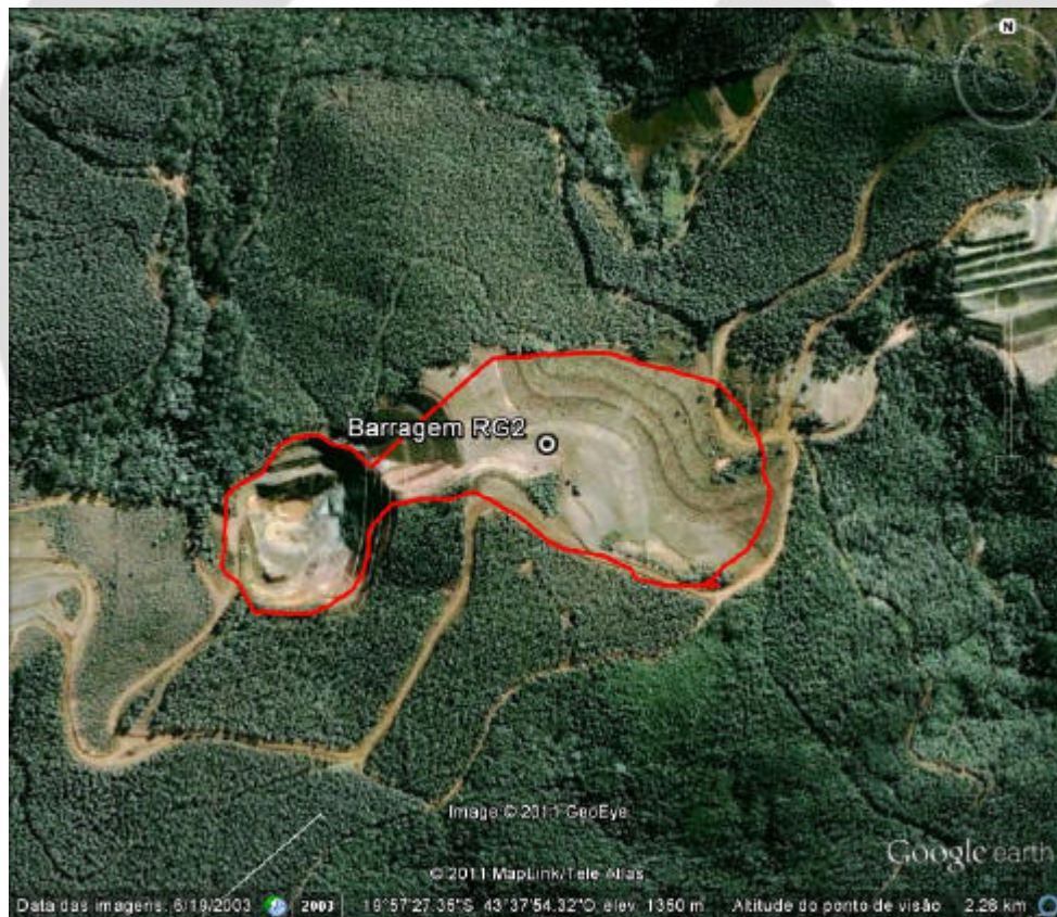
Figura 01: Área da Barragem RG2

O empreendimento de mineração de ouro está situado no local denominado Fazenda Serra Luiz Soares, Município de Caeté – MG. Seu acesso se dá a partir de Belo Horizonte pela Rodovia BR 381 (sentido Vitória). Percorre-se 30 km até o trevo que dá acesso à cidade de Caeté; percorre-se mais 13 km pela MG 435 até a cidade de Caeté; mais 5 km atravessando a cidade no sentido sudeste, segue pela estrada de acesso a Gongo Soco / Barão de Cocais e percorre-se 8 km em estrada de terra compactada até a portaria principal do empreendimento.