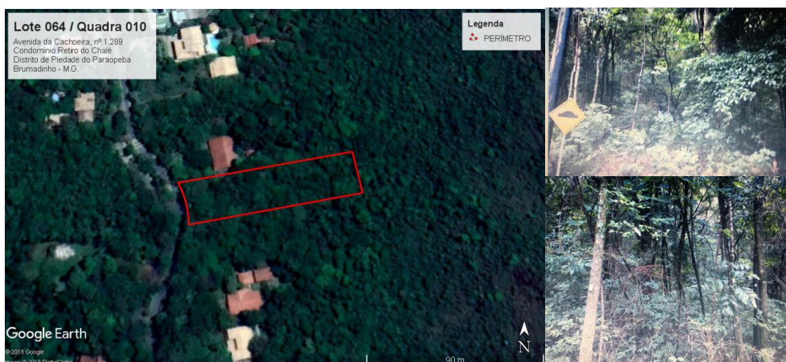
Figura 2. Imagem satélite, poligonal da área intervinda e compensação.

O projeto executivo propõe de compensação florestal uma área de 1.649,82 m 2 (0,164982 há), localizada no interior do próprio Lote 64, Quadra 10 do Condomínio Retiro do Chalé, localidade de Piedade do Paraopeba, município de Brumadinho. Esta área representa o dobro daquela que será diretamente atingida pelo empreendimento (824,91m 2 ), o qual terá interferência mínima sobre a vegetação. A localização da área de interferência, bem como da área na qual será executada a proposta de compensação podem ser visualizadas no Figura 1 . De acordo com PECF, a área destinada à compensação está inserida no interior do lote e contígua a área de intervenção, portanto, possui as mesmas características da área de intervenção. O referido fragmento se apresenta de forma adensada, conforme Fotos 3 e 4 . A referida área está inserida na APASUL RMBH e zona de amortecimento do Parque Estadual da Serra do Rola Moça.