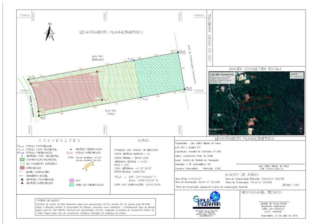
Figura 1. Localização do lote, da área de intervenção, da área de Compensação e da Área de Preservação. Fonte: PCMA nº 09010000537/18

supressão vegetal para construção de habitação/residência unifamiliar localizada no Condomínio Retiro do Chalé, Lote nº 64, quadra 10, no município de Brumadinho/MG, Bacia do Rio São Francisco e Sub-bacia Rio Paraopeba.