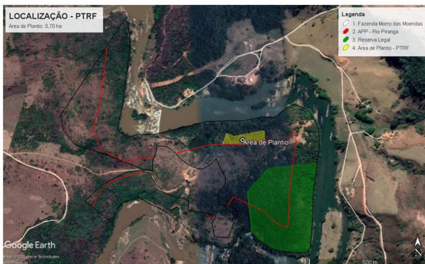
Figura 01. Localização da área de plantio.