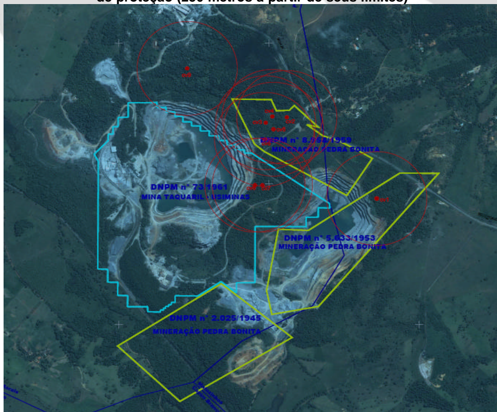
Figura 02: Localização das cavidades naturais subterrâneas amostradas e seus respectivos raios de proteção (250 metros a partir de seus limites)

Os estudos apresentados pelo empreendedor indicam a existência de 9 cavidades naturais subterrâneas na área envolvida neste processo de revalidação. Para cada uma delas, foi apresentada a caracterização física e os resultados provenientes do primeiro período de coleta de fauna (período seco). Como o segundo período de coleta ainda não havia sido realizado, não foi concluído o estudo da relevância dessas cavidades amostradas (Figura 02).