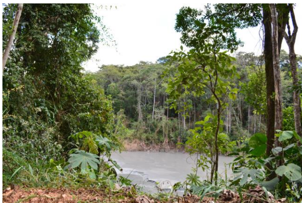
Foto 01. Vista de montante do reservatório Barragem de Rejeitos Mina Cuiabá.

*Fotos tiradas em vistoria realizada em julho de 2014, pela equipe técnica da SUPRAM CM.