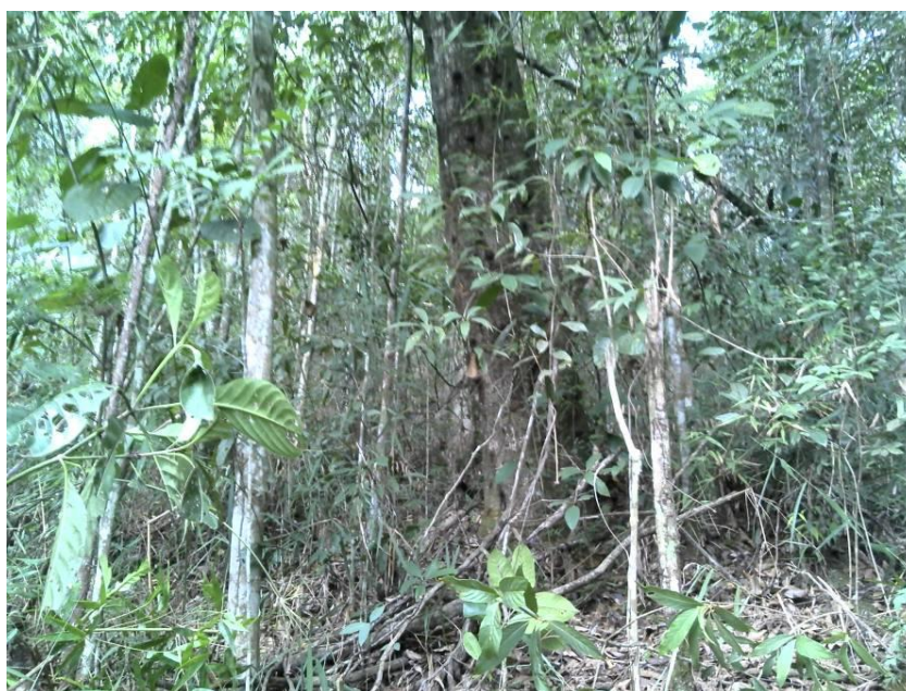
Figura 02 – Vegetação mais fechada na área de supressão de Cuiabá. Fonte: Bios Consultoria/ julho/2013.

A zona de transição dos biomas Mata Atlântica e Cerrado confere à vegetação local grande diversidade, que reflete na formação de grandes extensões florestais de Floresta Estacional Semidecidual, em locais de maior umidade, entremeada por espécies de cerrado nas áreas mais altas e secas. Além disso, a inserção do município no quadrilátero ferrífero confere à área grande potencial de endemismo de espécies vegetais, uma vez que as plantas que se encontram sobre o substrato de minério de ferro desenvolveram especializações fisiológicas para conseguirem colonizar ambientes com escassez de recursos ecológicos, o que também as impede de se adaptarem a outros locais.