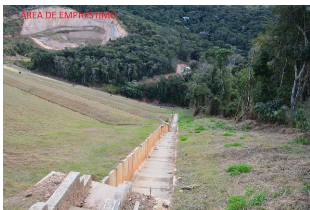
Foto 03: Vista do canal do vertedouro; da área de empréstimo (fundo da foto) e a esquerda, parte do talude de jusante da barragem.