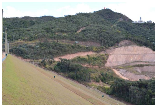
Foto 04: Vista do talude de jusante da barragem com pontos de monitoramentos automatizados.