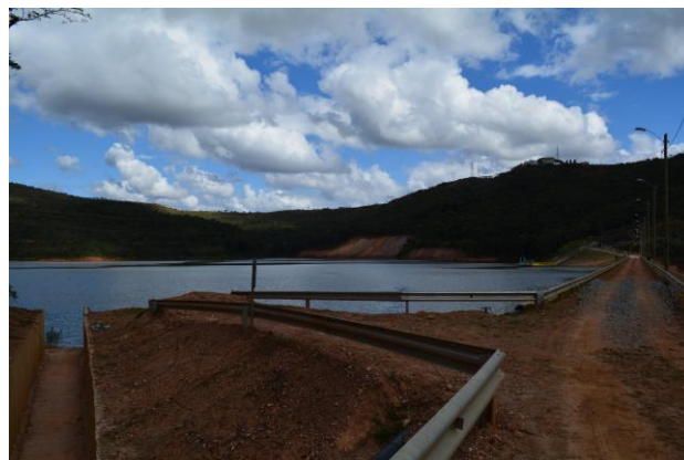
Foto 02. Vista a jusante da Barragem de Rejeitos Mina Cuiabá (à direita da foto vista da Crista da Barragem).