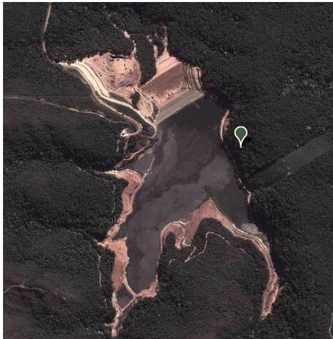
Figura 01: Barragem de Rejeitos Mina Cuiabá a ser licenciada.

A barragem de rejeitos (Figura 01) ora licenciada é uma das estruturas da Mina Cuiabá de propriedade da AngloGold Ashanti Córrego do Sítio Mineração S.A empresa produtora de ouro, com matriz em Johannesburgo, na África do Sul, que mantém operações em diversos países. No Brasil, possui unidades nos estados de Goiás e Minas Gerais.