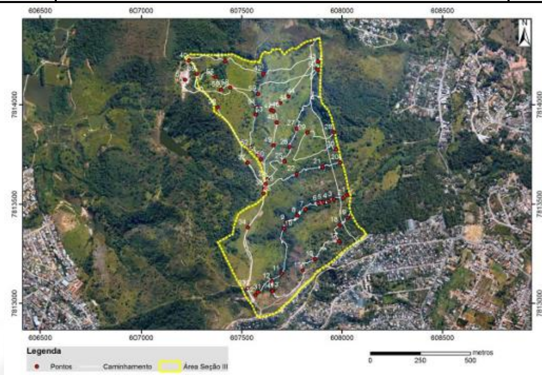
Figura: “Mapa Espeleológico”.

Não foi observada nenhuma feição cárstica típica (cavidades subterrâneas, paredões de rochas calcárias, lapiezamento, paisagem do tipo ruiforme e dolinamentos). Na ADA há ocorrência litológica de gnaisses, anfibolitos e xistos, rochas estas muito pouco solúveis e onde as feições espeleológicas mais comuns são os abrigos sob rocha existentes isoladamente. Embora há ocorrência de afloramentos pontuais de gnaiss, não foi observada a presença de nenhum abrigo na ADA. Ainda, o empreendedor apresentou complementação do levantamento espeleológico realizado no entorno imediato da ADA (faixa de 250 metros), cujos resultados foram semelhantes aos encontrados na ADA, assim, não havendo restrições ao empreendimento.