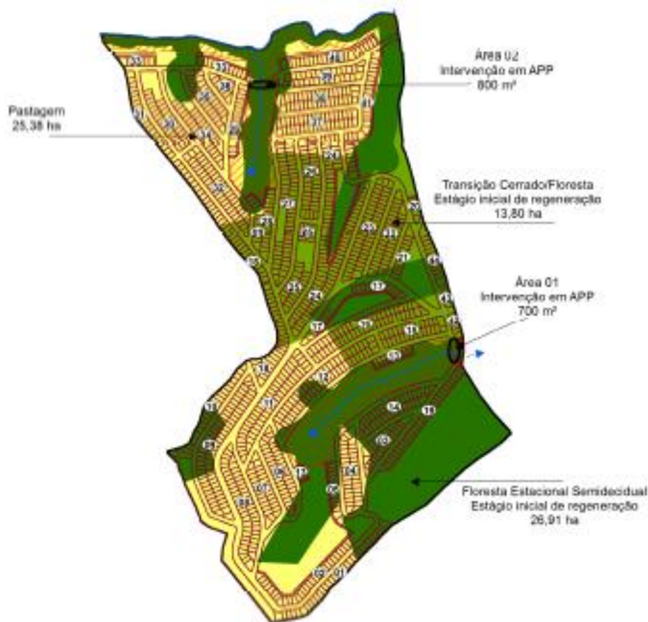
Figura: Uso e ocupação do Solo.

O inventário florestal, com alocação de parcelas retangulares fixas de 1.000 m 2 (50m x 20m) para as áreas de fragmentos florestais foi utilizado o processo de Amostragem Casual Simples.