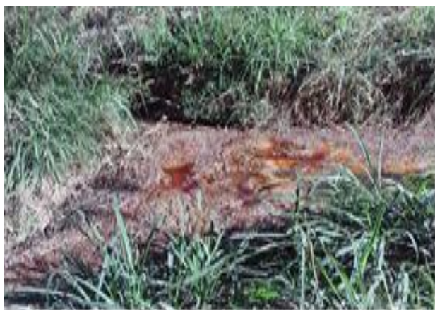
Poluição hídrica em 2012 escopo do TAC Foto 09.