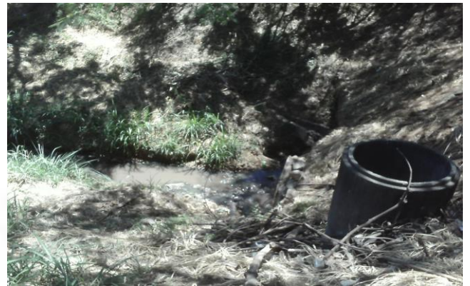
Córrego Bicas – a jusante lançamento 2014 Foto 06.