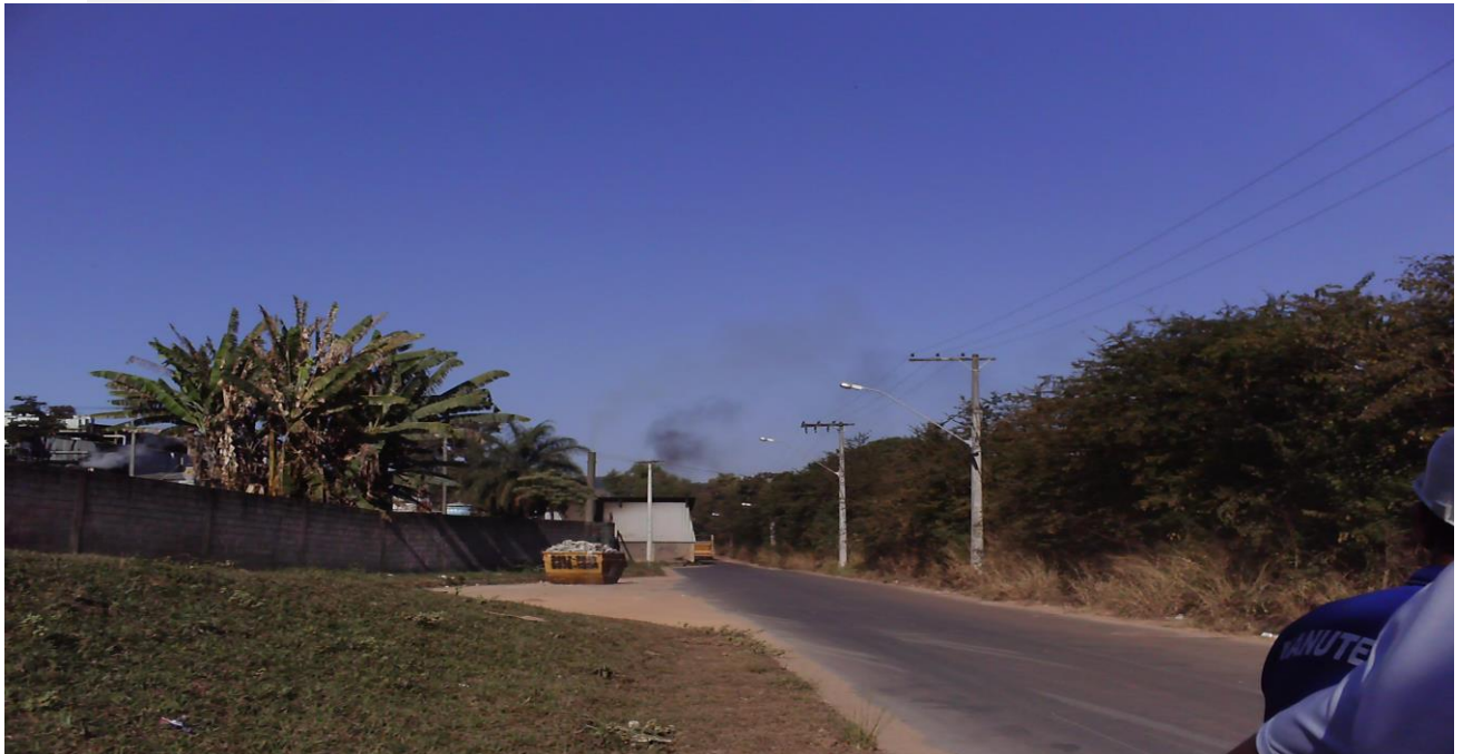
Visão geral do perímetro do empreendimento junto ao Córrego Bicas e logradouro público - APP consolidada Foto 02