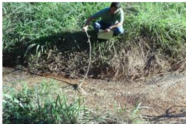
Poluição hídrica em 2012 escopo do TAC Foto 10..