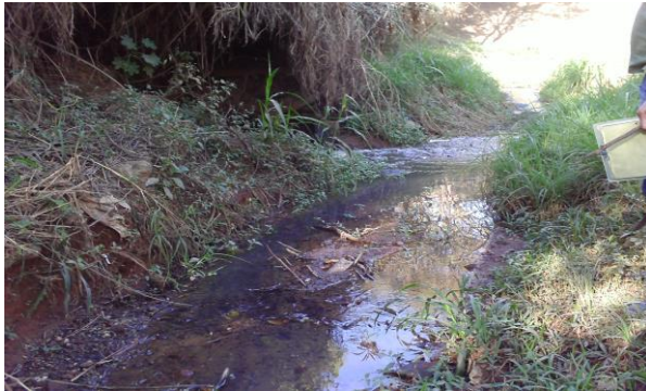
Descarte irregular efluente lavador de veículos do empreendimento – 2012 Foto 03.