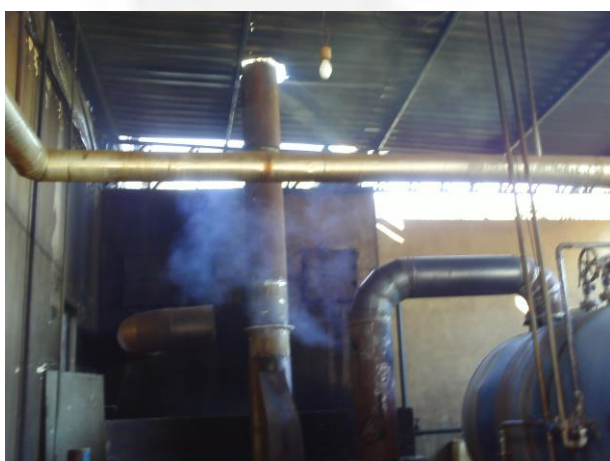
Caldeira operando sem lavador de gases - 2012 Foto 13..