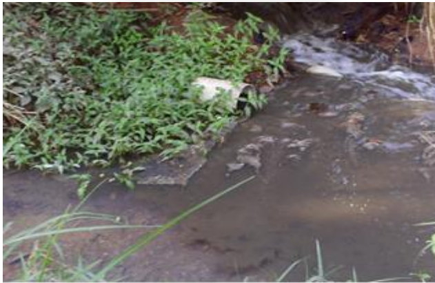
Lançamento – detalhe Foto 05.