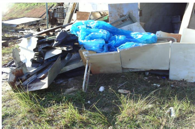
Depósito temporário de resíduos sólidos em 2012 escopo do TAC Foto 12..