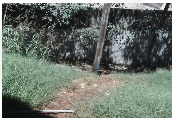
Contaminação solo material graxo 2014 Foto 14..