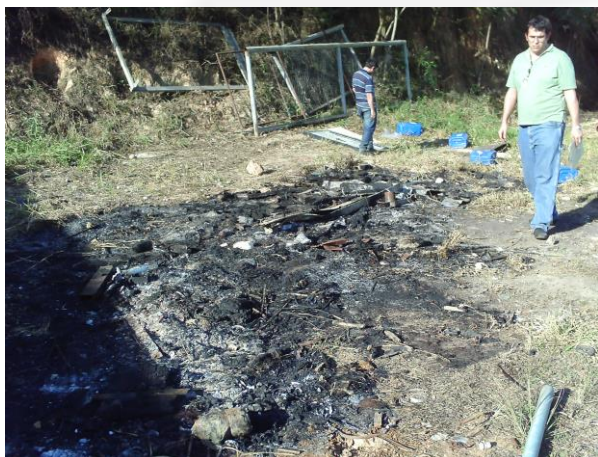
Queima de resíduos 2012 escopo do TAC Foto 11.