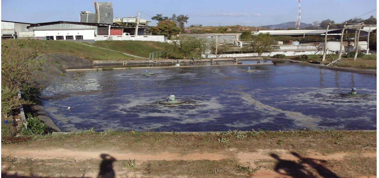
Visão geral do empreendimento e sua ETE Foto 01