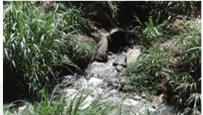
Visão do ponto irregular lavador de veículos do empreendimento. Foto 04.