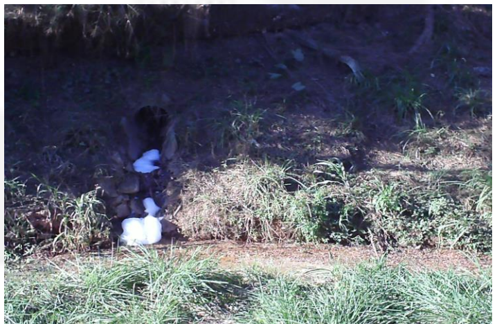
Visão do ponto irregular lavador de veículos do empreendimento. Foto 08.