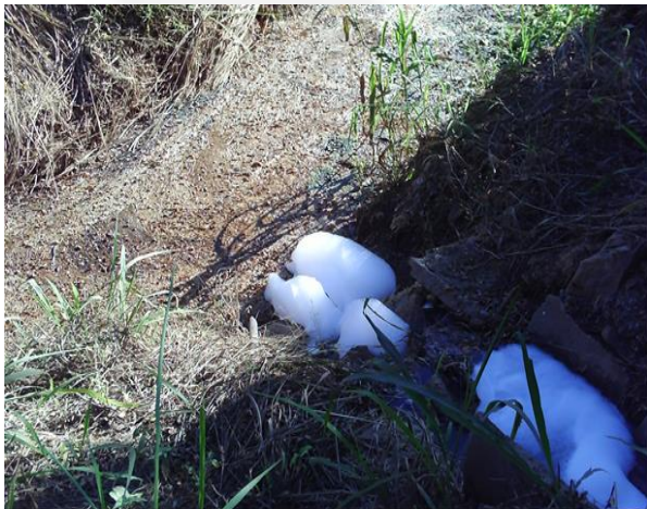
Descarte irregular efluente lavador de veículos do empreendimento - 2012 Foto 07.