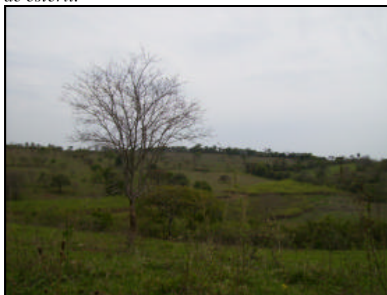
Foto 05. Outra vista da área onde será construída a pilha de estéril.