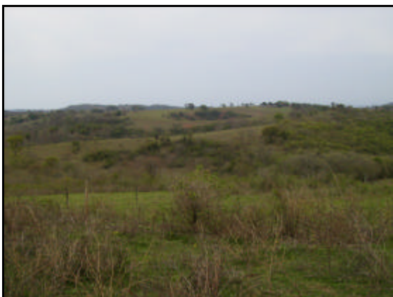
Fig 03. Idem foto 02.