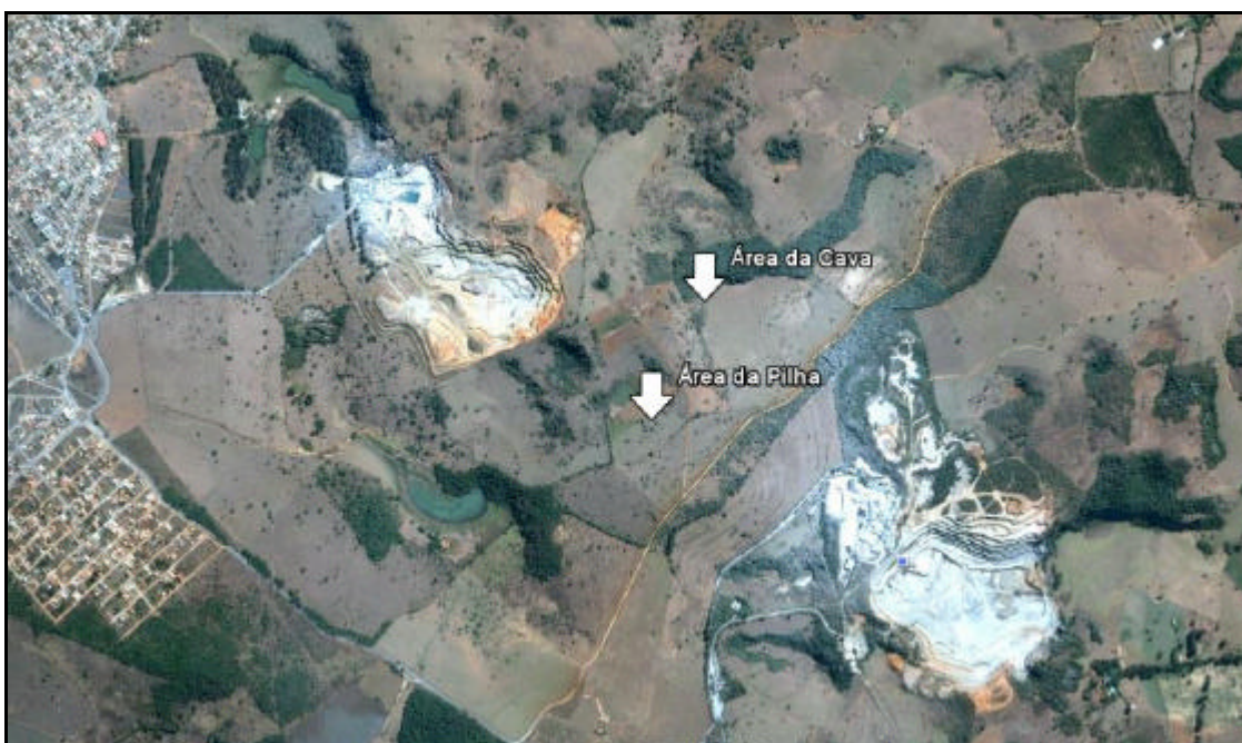
Imagem 02. Vista das áreas das estruturas (cava e pilha) da futura Mina Borges, situadas entre a Mineração Fazenda dos Borges (à esquerda) e Mineração Lapa Vermelha (à direita).