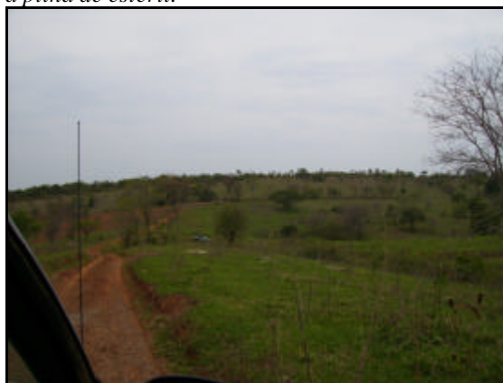
Fig 06. Idem foto 05.