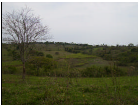
Foto 04. Vista da área onde será construída a pilha de estéril.