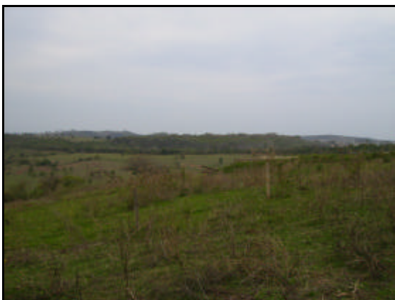
Foto 01. Vista da aérea onde ficará a cava.

Secretaria de Estado de Meio Ambiente e Desenvolvimento Sustentável Superintendência da Região Central Metropolitana de Meio Ambiente