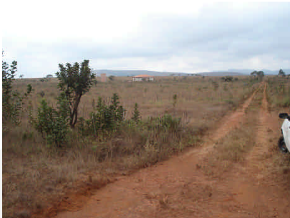
Figura 1: vista geral da área do pretendido empreendimento