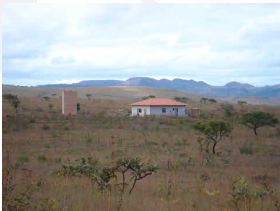
Figura 6: Edificação existente na área do empreendimento