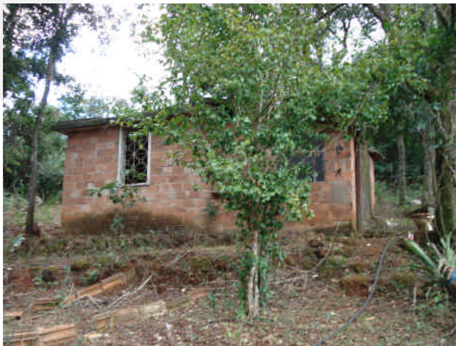
Figura 4: Construção existente na área de nascente (APP).