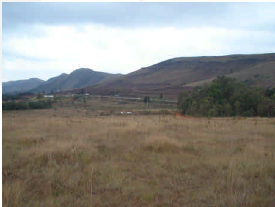
Figura 2: vista geral da área do pretendido empreendimento. Ao fundo a BR 040