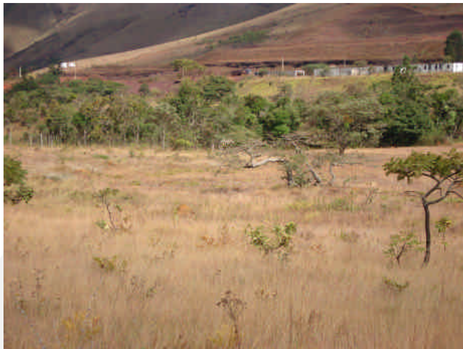
Figura 3: Vista geral da área do pretendido empreendimento. Ao fundo a mata ciliar, onde existe uma nascente.