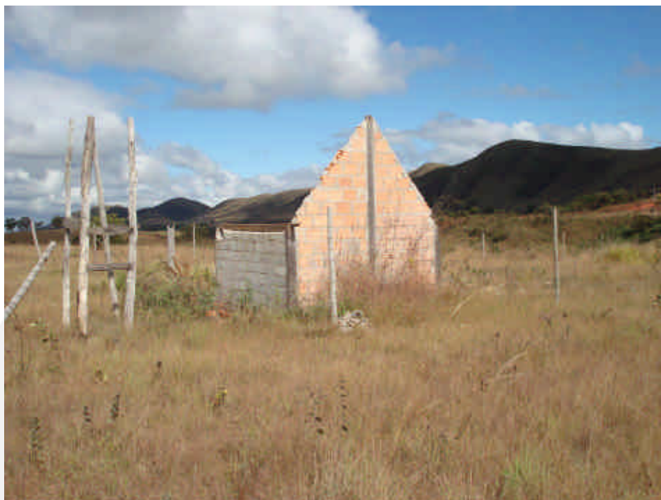
Figura 5: Ruínas existentes na área de empreendimento